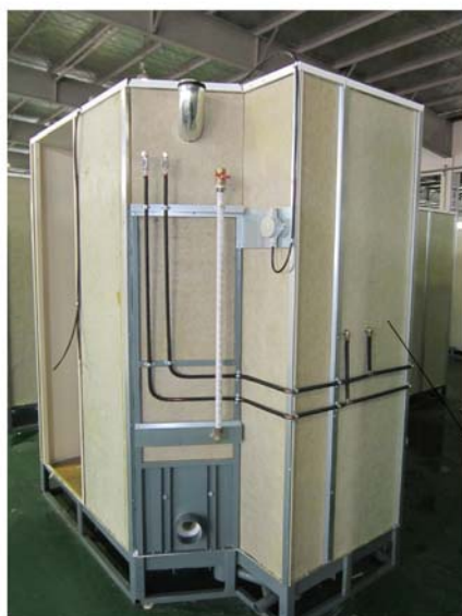
Marine Slab 180